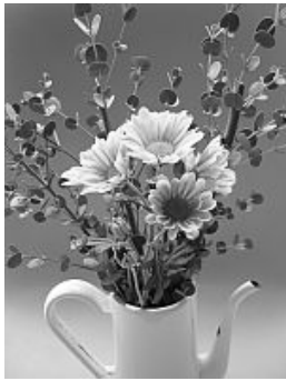
スプレー菊 スプレー(Spray)とは先が分かれた枝との意味で、小枝の先に多数の花を付けます。